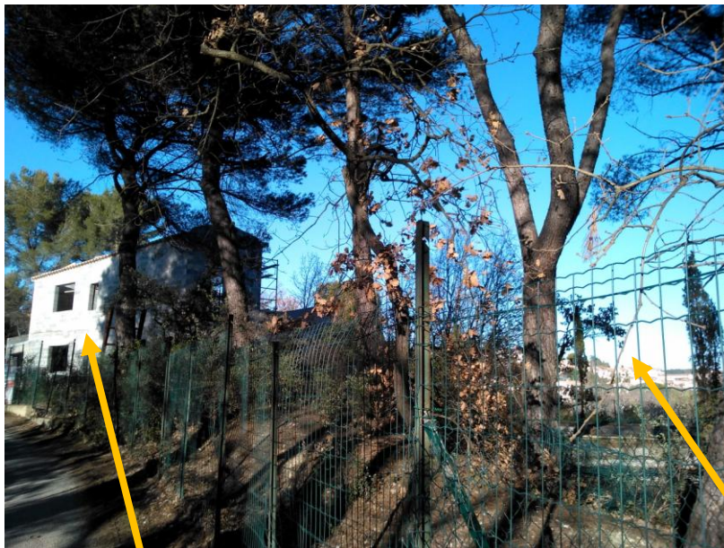
Nouvelle maison sur la crête