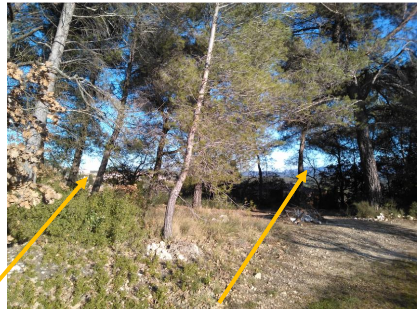
Vues sur Venelles-le-Haut